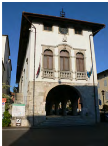
FOTO: La sede della Guarneriana antica

Interessante per gli studiosi di "storia patria del Friuli" un antifonario dell'anno 1000 relativo al martirio dei Santi Ermacora e Fortunato redatto in neumi in campo aperto, ovvero senza il rigo musicale, come era d'uso nell'antica